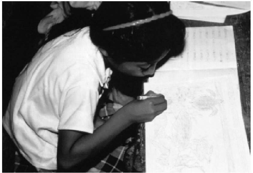
Un projet éducatif consacré aux tortues, au Guatemala