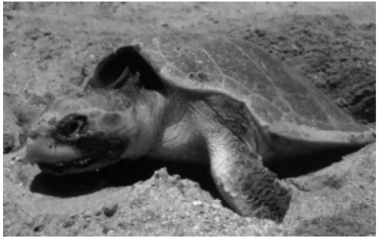
Une tortue de Kemp pond à Rancho Nuevo, au Mexique

Collecter des données sur les tortues marines dans le monde entier afin de déterminer leur statut au niveau mondial Enquêter sur les possibilités offertes par la CIVIS, la Convention sur la conservation des espèces migratrices appartenant à la faune sauvage, pour garantir la conservation durable à long terme des tortues marines dans des Etats sélectionnés sur leur parcours. S'il y a lieu, concevoir les principes applicables Evaluer la situation des tortues marines au regard d'autres conventions, traités internationaux et législations nationales. Evaluer les critères utilisés pour déterminer la situation des tortues marines Etudier les déterminations de statuts à des intervalles qui soient appropriés pour chaque convention ou traité