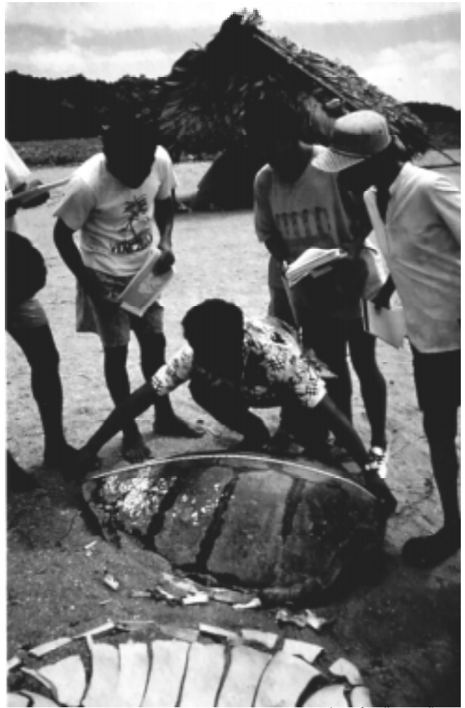
Les étudiants d'un cours consacré à la collecte de données sur les tortues en Guyane