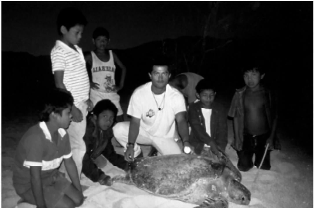
Des enfants Nahua et un employé du camp des tortues entourent une tortue noire à Michoacan, au Mexique