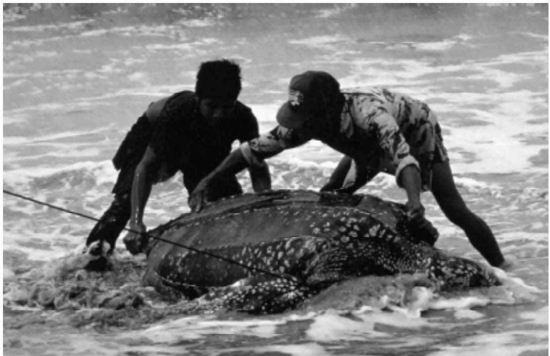
Des pêcheurs guyanais collaborant à la recherche de données vont relâcher une tortue luth qui a été capturée accidentellement