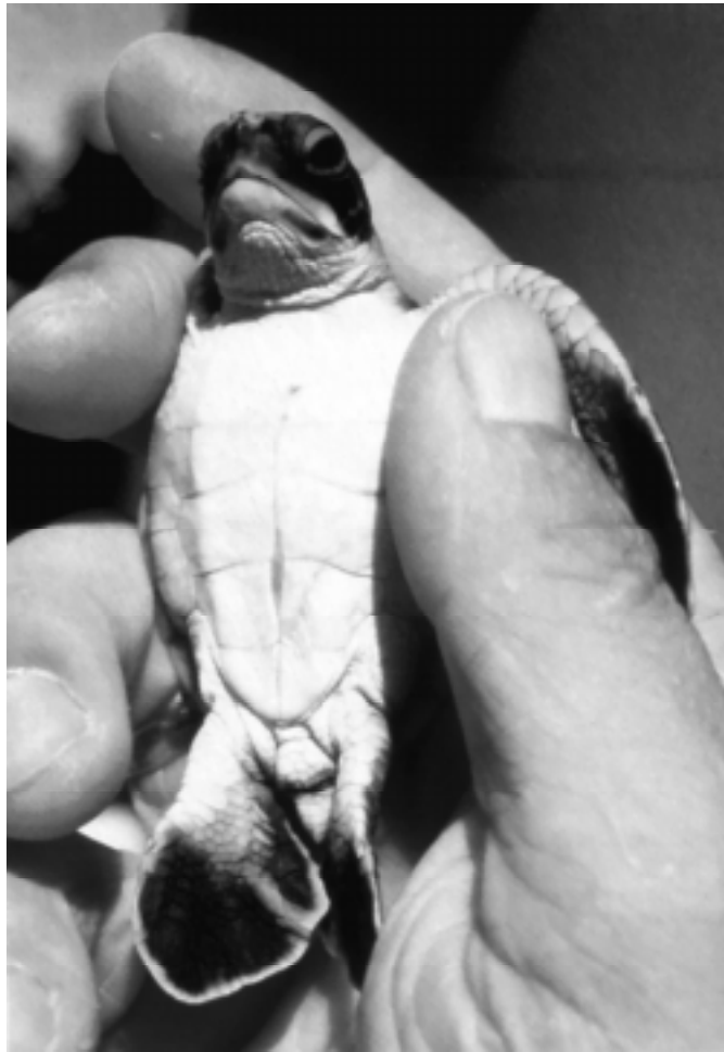
Une tortue verte vient d'éclore

Les tortues marines jouent un rôle important dans les écosystèmes dans lesquels elles vivent bien que les détails de ce rôle soient difficiles à démontrer lorsque, comme c'est le cas actuellement, les populations sont fortement réduites. Par exemple, les herbiers de phanérogames où les tortues vertes se nourrissent régulièrement sont plus productifs, les sels minéraux sont recyclés plus rapidement et les feuilles ont un taux de protéines plus