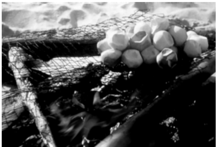
en haut Une caouanne presque adulte emmêlée dans un filet en bas : La cuisson d'oeufs de tortue luth dans un village amérindien de Guyane française