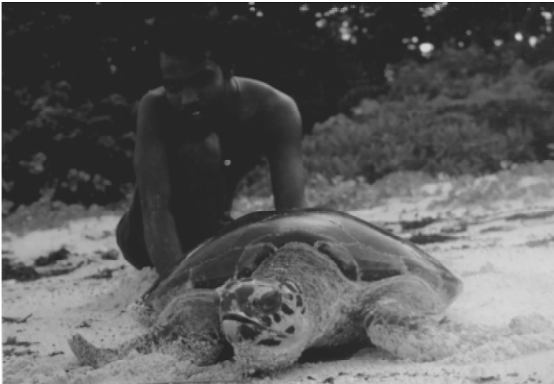
Un chercheur observe une tortue à écailles qui revient du nid vers la mer, en Inde